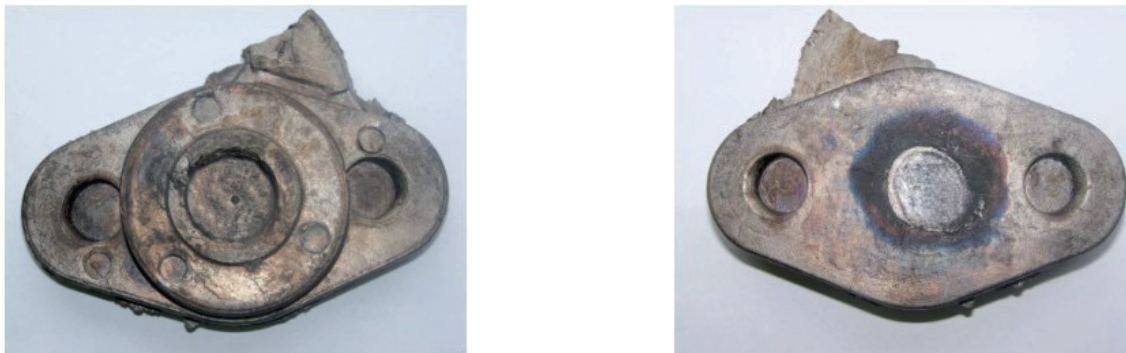
Rys. 1. Zdjęcia ciśnieniowego odlewu z żeliwa białego Fig. 1. Pictures of a white cast iron pressure casting