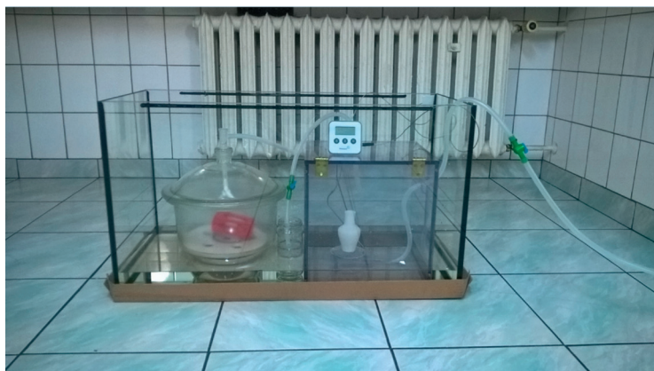
Rys. 2. Komora acetonowa Fig. 2. Acetone chamber

Otrzymane wyniki przedstawiono w tabelach 1, 2 i 3. The results of research are presented in Tables 1, 2 and 3.